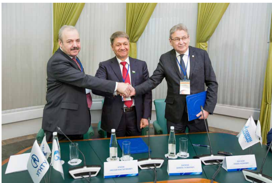
Сотрудничество предприятия с УГНТУ и УГАТУ с каждым годом расширяется

– Мы видим, что даже краткое перечисление того, что сделано и что только еще предстоит сделать, свидетельствует об особой роли «Газпрома» в жизни страны, в развитии ее