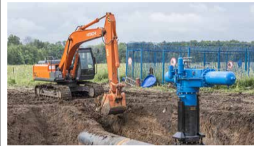
ГОРЯЧАЯ ПОРА стр. 4, 6