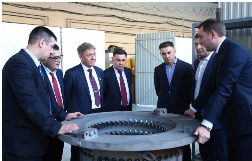
Быть поставщиком «Газпрома» непросто

Башкирские газотранспортники активно содействуют расширению использования высокотехнологичной продукции Башкортостана в интересах ПАО «Газпром». ООО «Газпром трансгаз Уфа» успешно реализует «дорожную карту», предусматривающую взаимодействие «Газпрома» и Правительства республики по привлечению возможностей региональных производителей высокотехнологичной продукции для нужд газовой отрасли. На сегодня 94 вида продукции, выпускаемой в регионе, включены в реестры оборудования, материалов и технологий, допущенных к применению на объектах «Газпрома». По итогам конкурсных закупок компанией уже приобретено 55 видов региональной продукции; только в первом полугодии 2017 года сумма контрактов составила порядка 1,4 млрд руб.