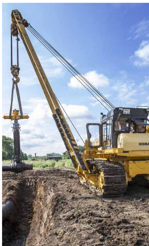
Монтаж шарового крана на МГ Поляна–КСПХГ

Проведена внутритрубная диагностика на газопроводе-отводе к ГРС Белорецк, врезка отремонтированного участка газопровода-отвода к ГРС Сибай на 37 км, замена линейного крана на газопроводе-отводе к ГРС Укшук, ремонт участка магистрального газопровода Магнитогорск–Стерлитамак на 171 км, замена трубопроводной и регулирующей армату-