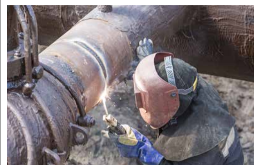
ПОЧЕРК МАСТЕРА стр. 4