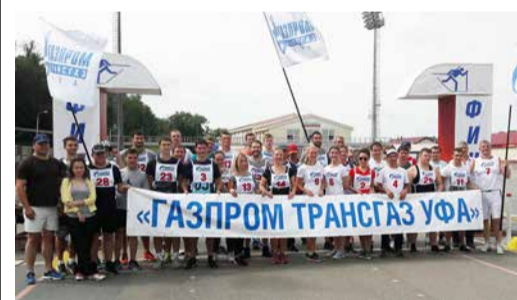
Я ЛЮБЛЮ ГТО! стр. 7