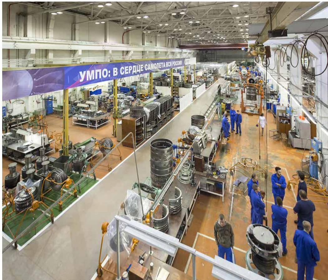
Сборочный цех Уфимского моторостроительного производственного объединения

му обслуживанию газотурбинных двигателей АЛ-31СТ. Это совместное решение является логическим продолжением успешно проводимой нами программы повышения надежности этого двигателя. Отмечу, что в этом году авторский коллектив Общества удостоен премии I степени имени академика А. Льюльки за успехи в создании новейших образцов высокоэффективной техники.