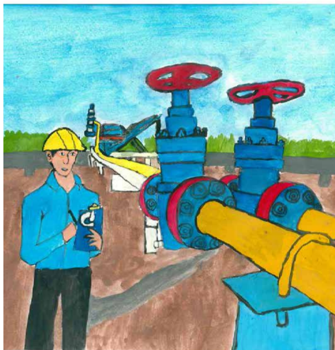
Рисунок Антона Блиникова