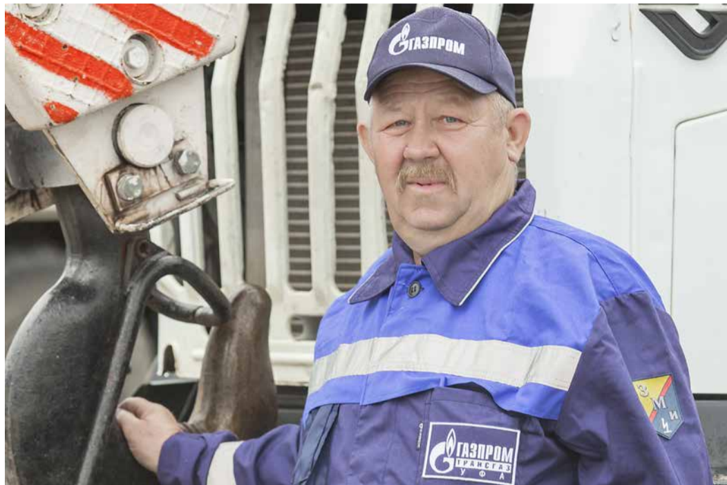
Машинист крана должен перемещать грузы без права на ошибку

Летопись предприятия пишут ее работники, каждый из которых вносит бесценный вклад в развитие производства. В большинстве своем – это люди скромные, не привыкшие говорить о своих достижениях. В канун профессионального праздника мы встретились с одним из таких газотранспортников.