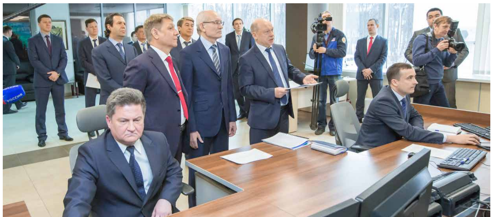
Глава РБ Рустэм Хамитов во время посещения диспетчерского центра Общества (2017 г.)

Уфа – третий по протяженности город России после Сочи и Волгограда.