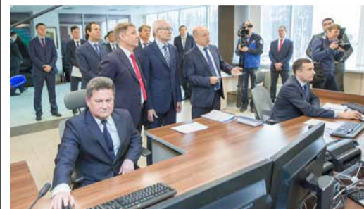
СИНЕРГИЯ ВОЗМОЖНОСТЕЙ стр. 2