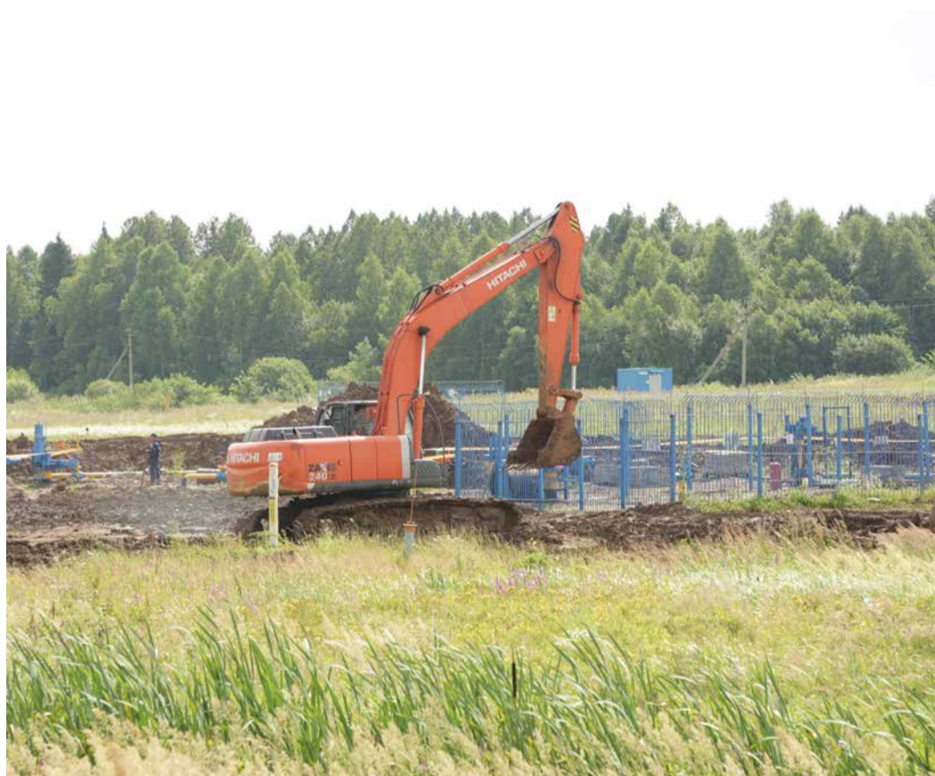
Работы на узле подключения КС-17А Полянского ЛПУМГ (МГ Уренгой–Новопсков)