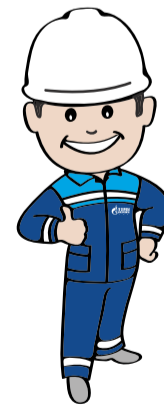
В ГОСТЯХ У ГАЗОВИЧКА стр. 8