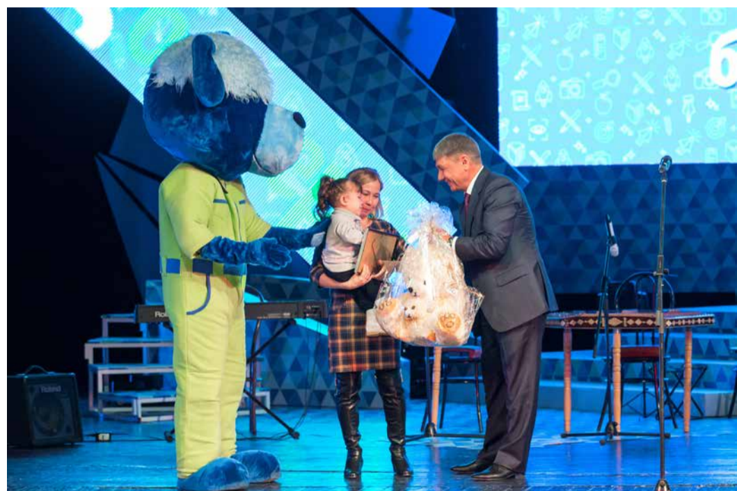
Фестиваль «Ломая барьеры» помогает формировать правильное отношение к проблемам инвалидов

Мы исходим из того, что школа, вуз и работодатель – это единый кластер, в котором нуж-